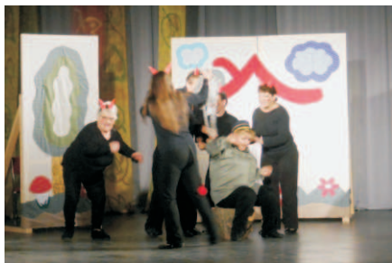
A Csakazértis Színkör előadás közben